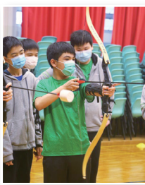
中一暑期適應課程