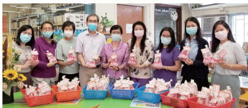
敬師日活動，製作禮物包