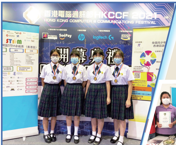
2021 年大灣區 STEM 卓越獎 (香港區)