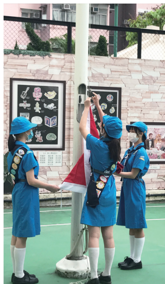
國家安全教育日 - 升國旗