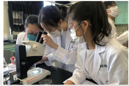
校本抽離式 STEM 課程：進行先進生物科技實驗