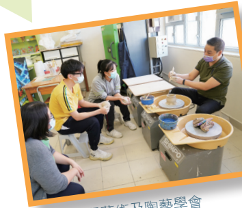
視覺藝術及陶藝學會