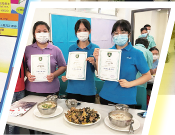
第二屆制服及青少年團隊 烹飪邀請賽 (性價比最高獎)