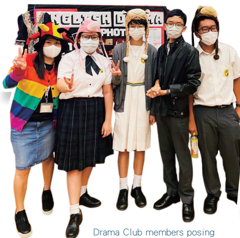
Drama Club members posing for the camera

To provide a place for students to embrace and hone their English skills, Room 111 has been turned into an English Room and a Study Room. On top of that, the English Department has recruited students to become English Ambassadors, which is definitely good news to teachers. Apart from helping out during English activity days, the Ambassador Team will be happy to help you with your homework. Feel free to come by in the first and second recesses and we'll lend you a helping hand.