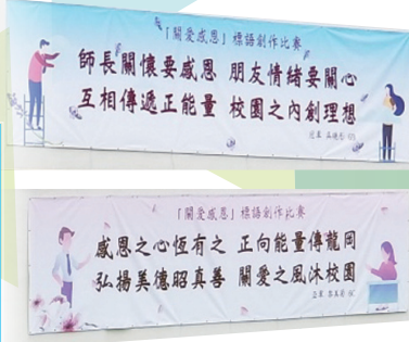
「關愛感恩」標語創作比賽

本校校風優良，嚴謹淳樸，學生大多來自區內家庭，尊敬師長，知禮守規。本校師資優良，全部教師皆持有大學學位及受過師資訓練，近六成教師擁有碩士學歷，亦有一位具博士學歷。