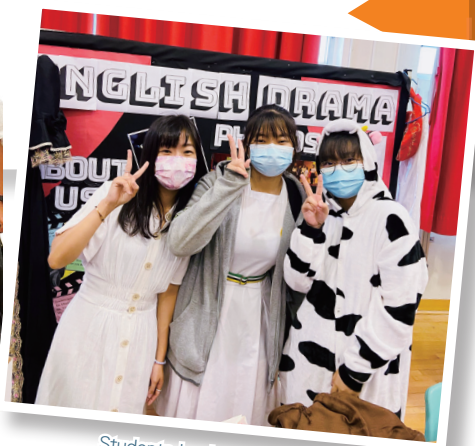
Students having a good time